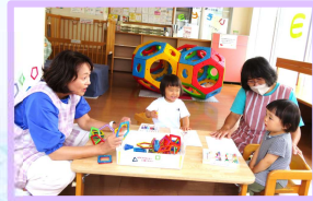
＊いそピヨでの預かりの様子＊

提供・両方会員 向け研修会 【磯子区開催】 ①7/8・7/9 ②2/25・2/26